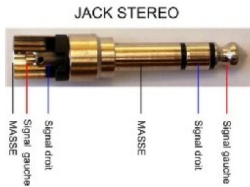
Photos du montage